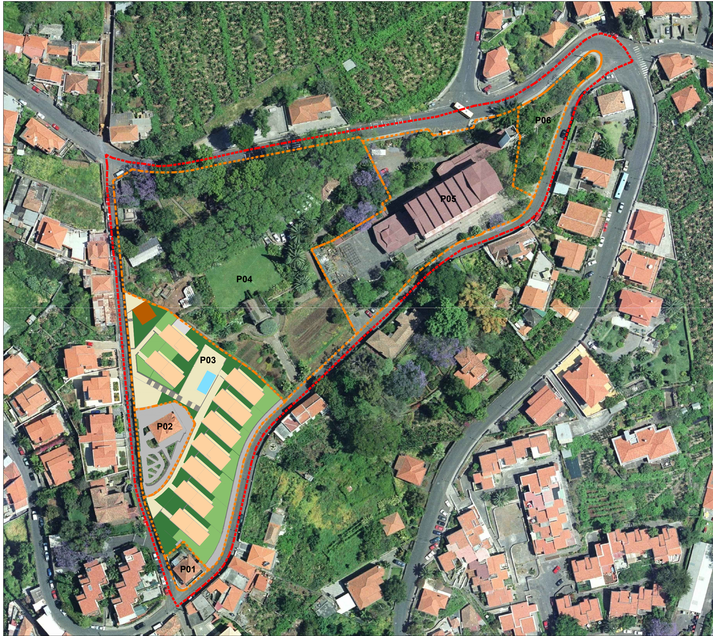
Planta da Situação Existente / Ortofotomapa Actualizado